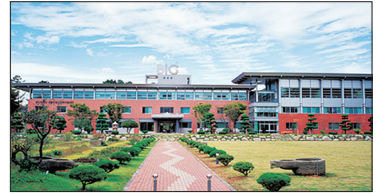
동신대학교 바이오센터 (노안방면 5km 지점)