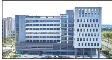
동신대학교 에너지클러스터 (빛가람동 방면 13.5km)