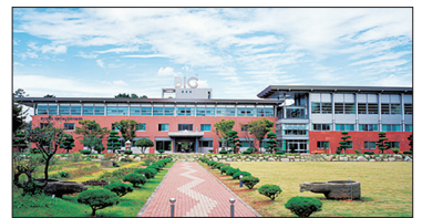
동신대학교 바이오센터 (노안방면 5km 지점)