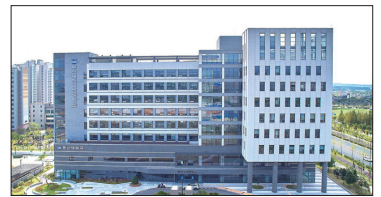
동신대학교 에너지클러스터 (빛가람동 방면 13.5km)